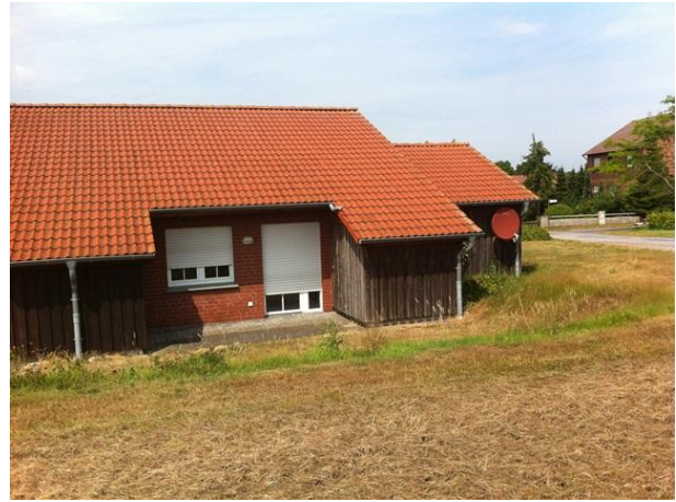
Ansicht von hinten/Terrasse