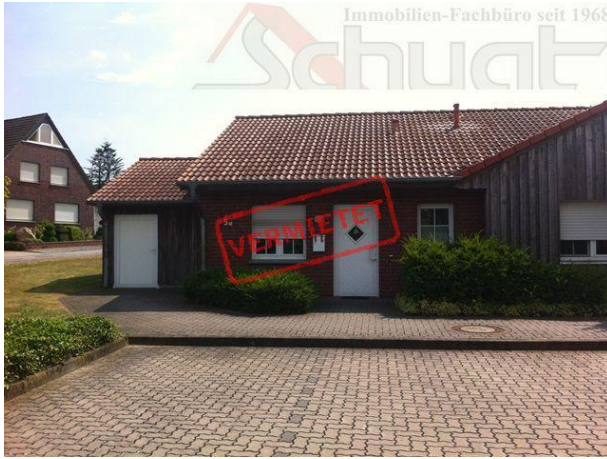
Ansicht von vorne