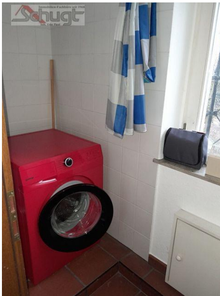
Raum für die Waschmaschine