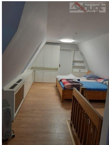
Schlafzimmer im DG