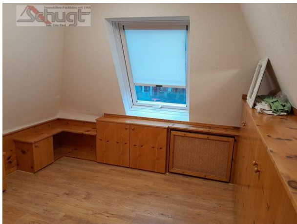
Ankleiderzimmer im DG