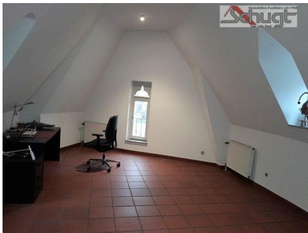
Kinderzimmer oder Büro