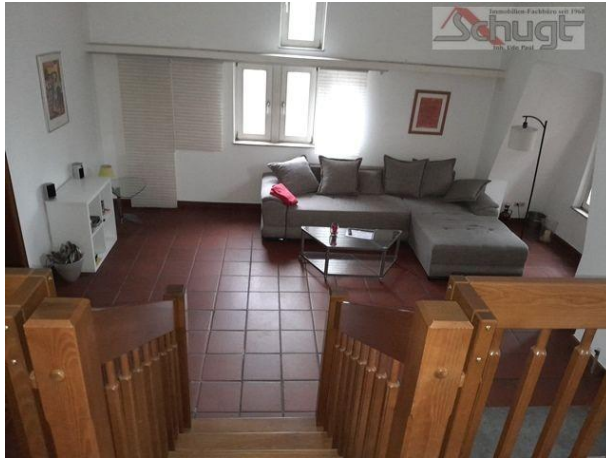
Blick ins Wohnzimmer