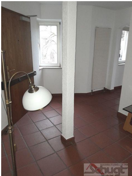
Eingangsbereich im 1. OG