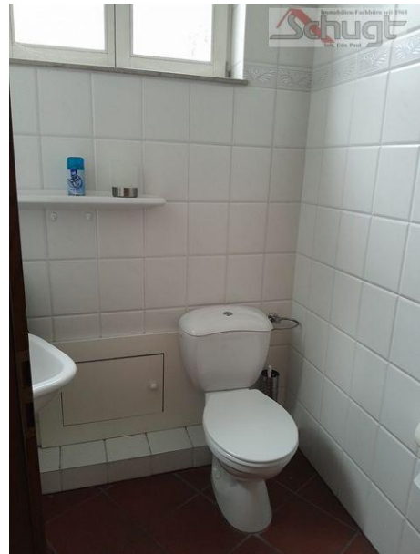
Gäste WC im 1. OG