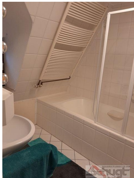
Bad mit Wanne im DG