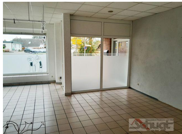
Schaufenster von innen