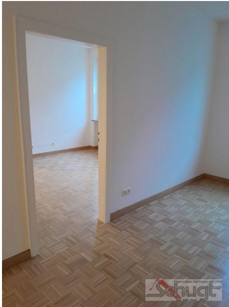
Durchgang zwischen 2 Räumen