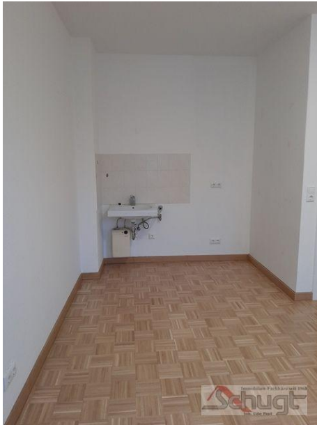
Küchennische im Aufenthaltsraum