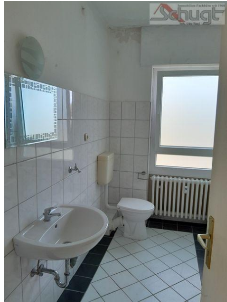
Bad mit Duschwanne